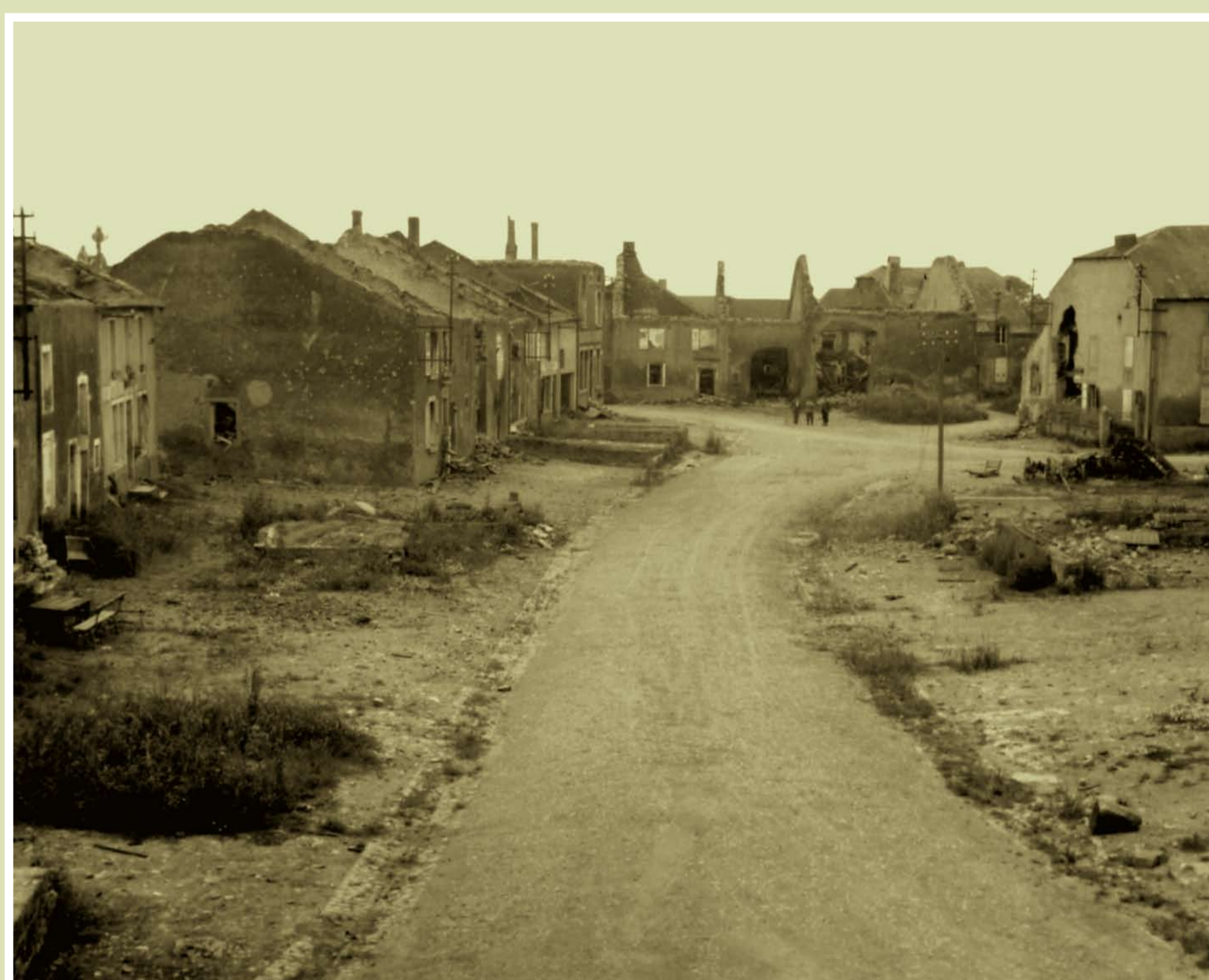
ROCHONVILLERS, après la Seconde Guerre Mondiale

Pour endiguer cette chute démographique, les municipalités successives s'engagent dans une politique de développement économique et urbain , mettant l'accent sur la création de lotissements ou de zones artisanales. L'évolution démographique, positive dans les années 1990, tend à se stabiliser.