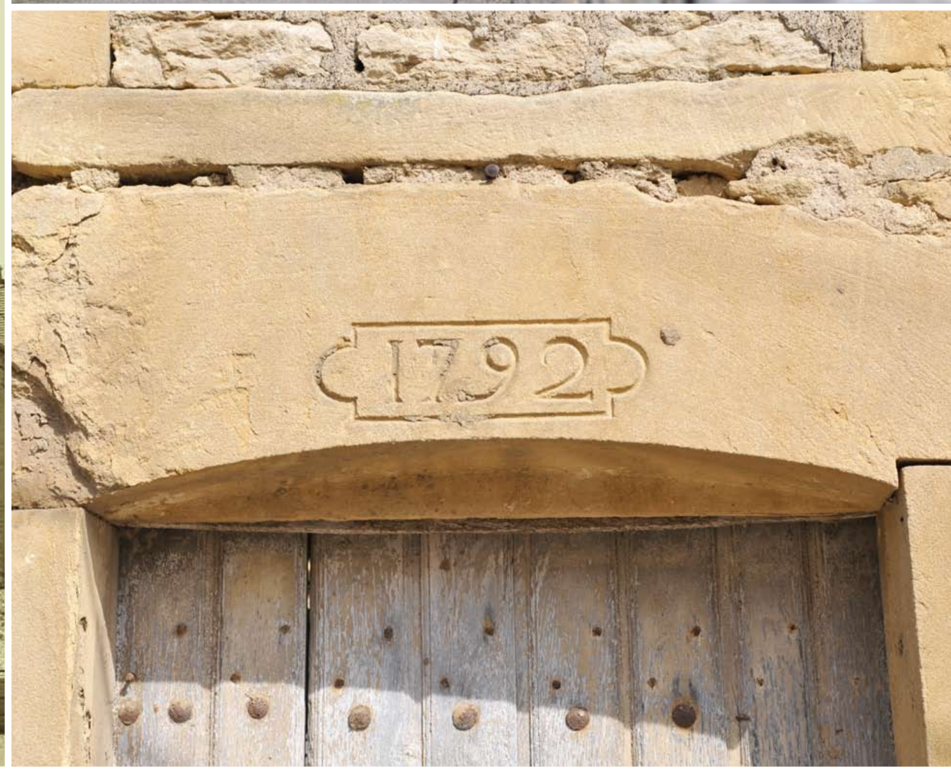
LOMMERANGE, fronton de porte daté de 1792

Au Moyen Âge , les communes dépendent des duchés de Lorraine puis de Bar. Fontoy, Angevillers et Rochonvillers passent sous suzeraineté luxembourgeoise en 1370 et le restent jusqu'au XVII e siècle. L'essentiel des communes intègre le Royaume de France lors de la Paix des Pyrénées en 1659.