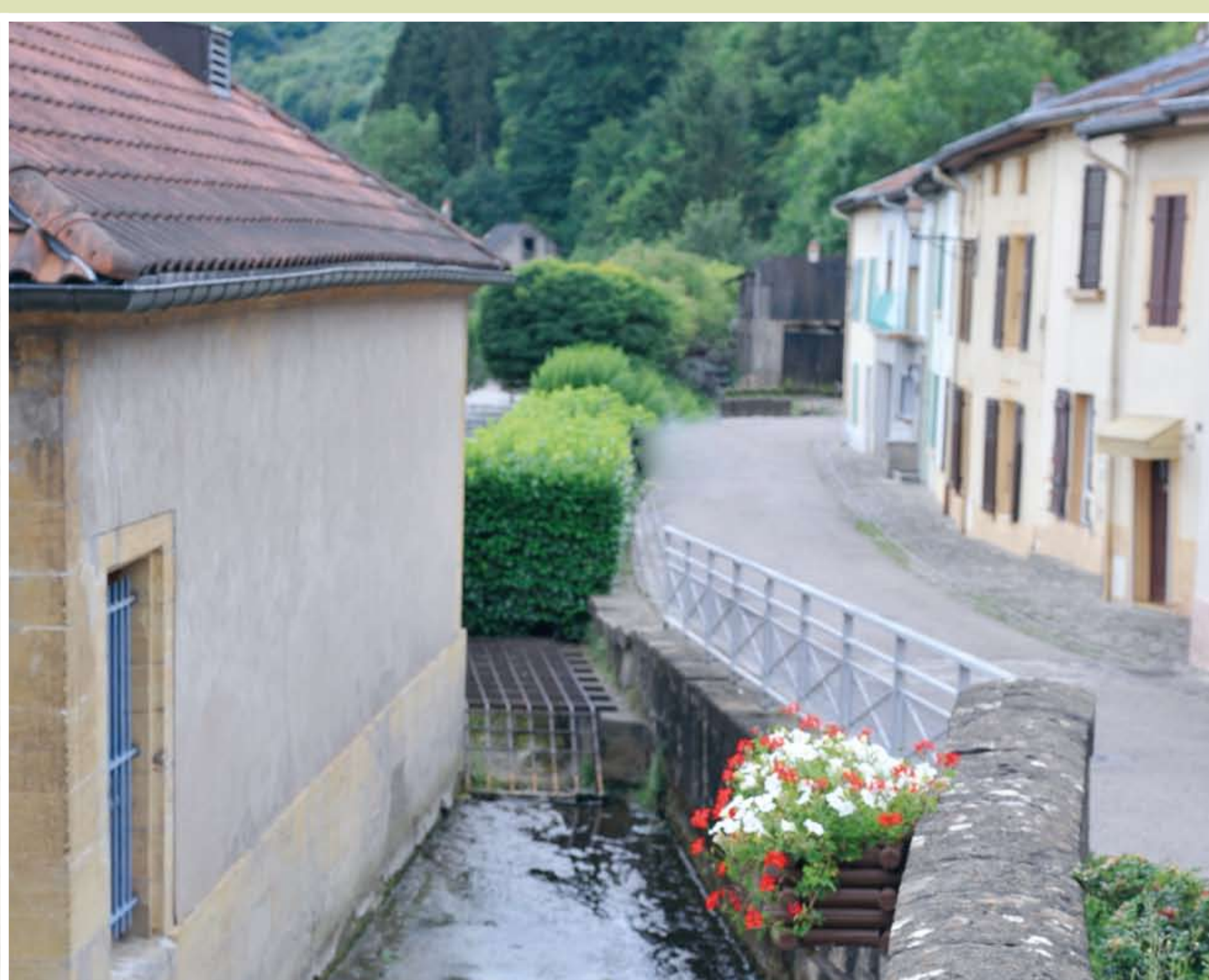
FONTOY, rue de la Fensch.