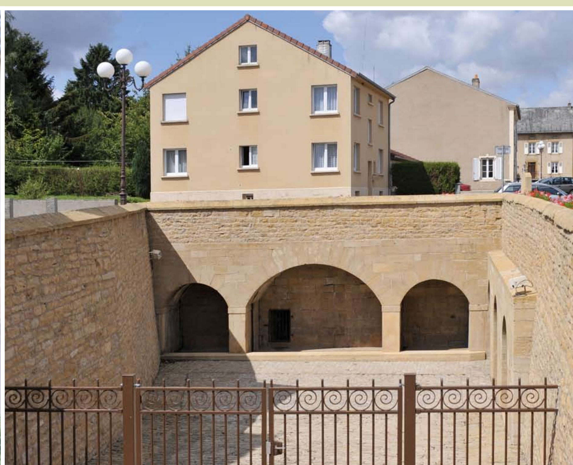
TRESSANGE, la fontaine-lavoir